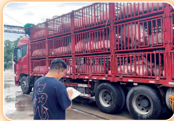
7月13日,杭州径山,夏日炎炎,浙江农合畜牧科技公司员工叶国鑫、曹永洪在工厂外维修焊接用于车间使用的小推车。

连日来,高温“烤”验持续不断。炎炎夏日,滚滚热浪,在浙农有这么一群人,与骄阳为伍,同高温作战,坚守岗位、奋力拼搏。汗水浸透的衣衫、晒得黝黑的皮肤,无一不展现了浙农人的担当。让我们一起直击最“火热”现场,向奋斗者们致敬!