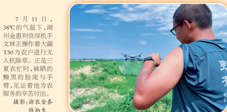
7月11日,38℃的气温下,湖州金惠利农资深机手文林正操作着大疆T50为农户进行无人机除草。正是三夏农忙时,被晒的黝黑的脸庞与手臂,见证着他为农服务的辛苦付出。